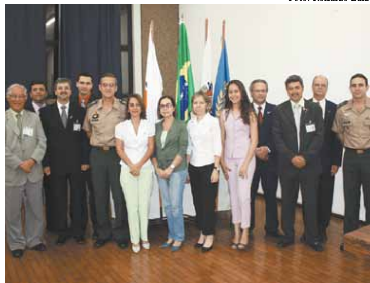
General Villas Boas e Marly Facuri com estagiários