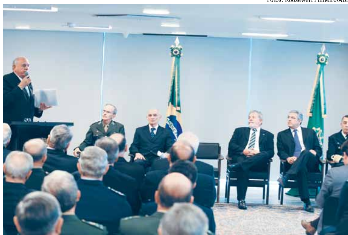
Solenidade de assinatura da Nova Lei de Defesa na Sala de Audiência do Palácio do Planalto

Além da transcrição do áudio, o LABDATA do CENIPA forneceu aos colombianos a animação dos dados para a análise dos parâmetros de voo. Desde janeiro, o LABDATA já realizou a extração de dados de 12 caixas-pretas.