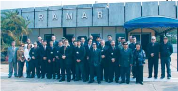
Estagiários no Centro Experimental da Marinha