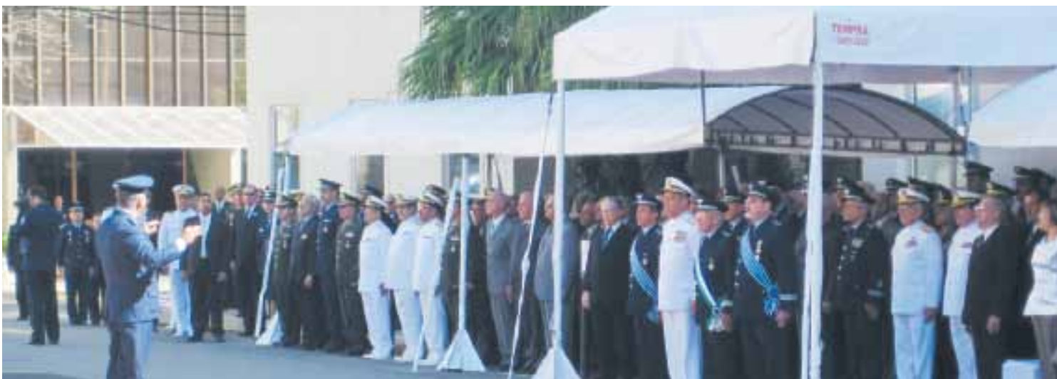
Solenidade de passagem de comando da Escola Superior de Guerra, realizada na sede da entidade, no Rio de Janeiro