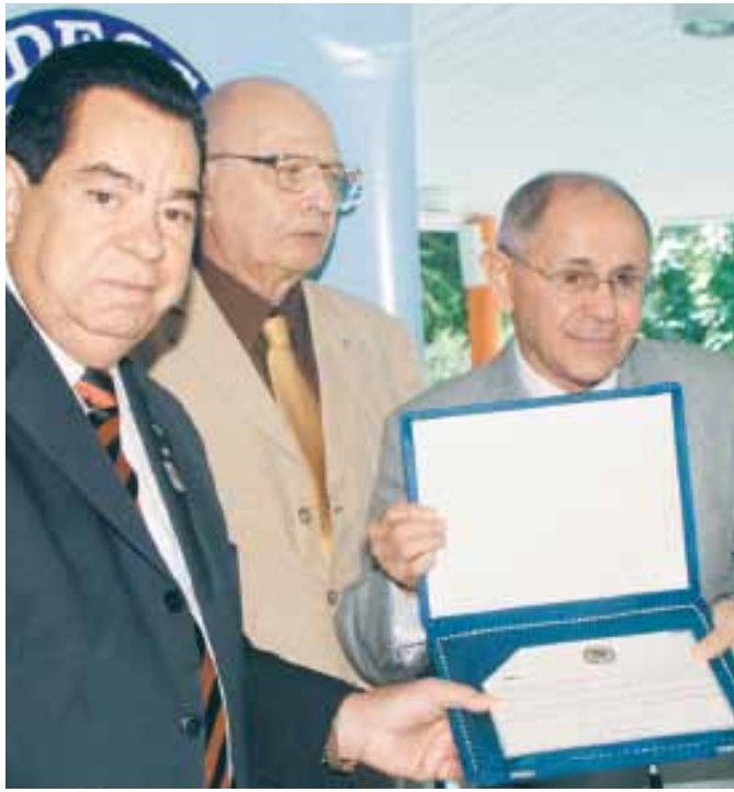
General Santa Rosa recebe placa comemorativa