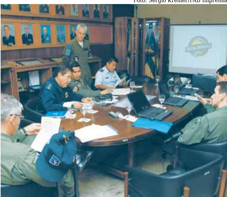
Oficiais do Bolbra I analisam relatório da programação

Segundo o oficial responsável pela programação aérea e planejamento das missões da