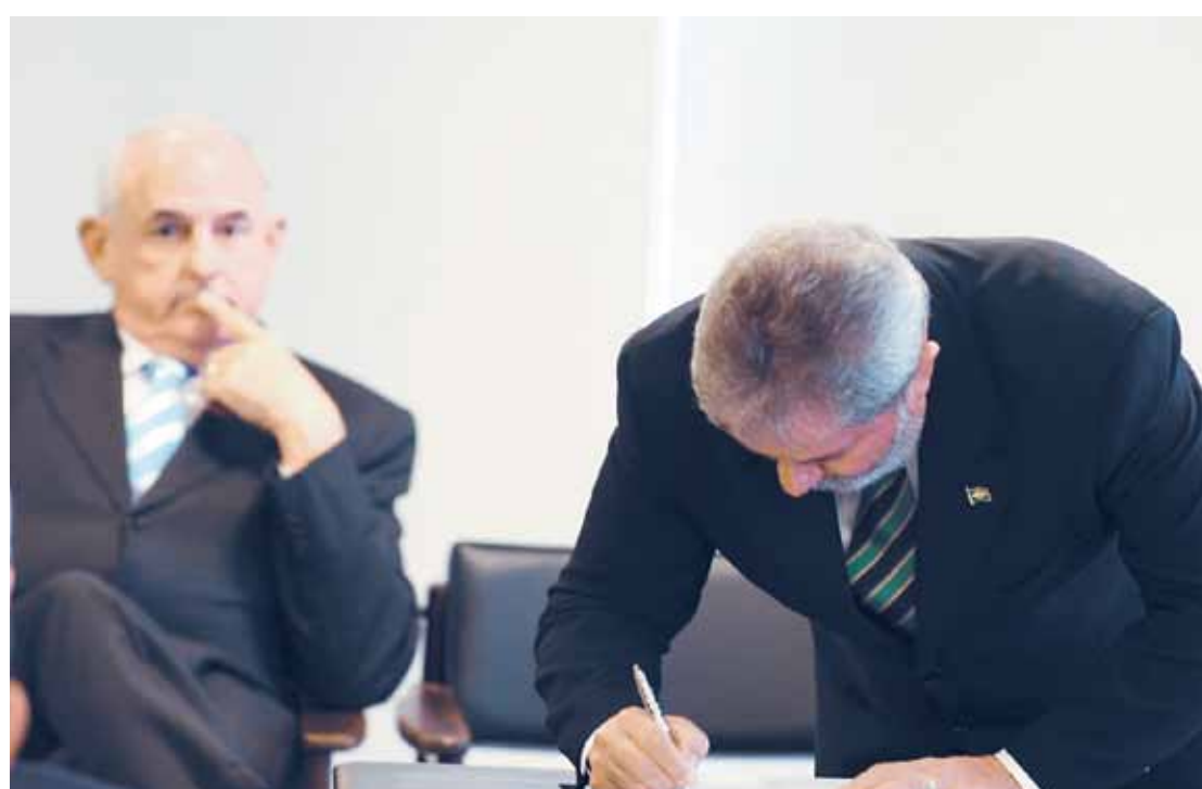
O presidente Lula assina nova Lei de Defesa, observado pelo Ministro Nelson Jobim

Em solenidade na Sala de Audiência do Palácio do Planalto, o presidente Luiz Inácio Lula da Silva sancionou, em agosto, a Lei que estrutura a Nova Defesa.