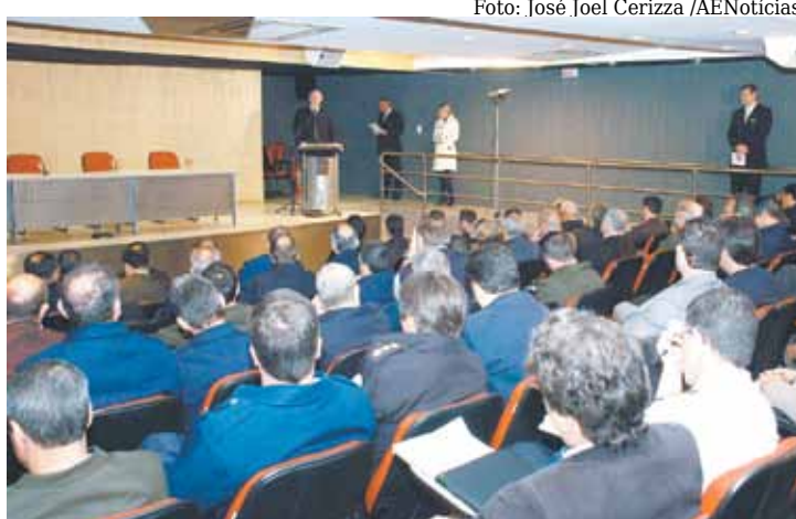
O governador do Paraná realiza palestra para estagiários da ESG

A programação de visitas, que durou dez dias, incluiu ainda Rondônia, Acre, Mato Grosso e Mato Grosso do Sul.