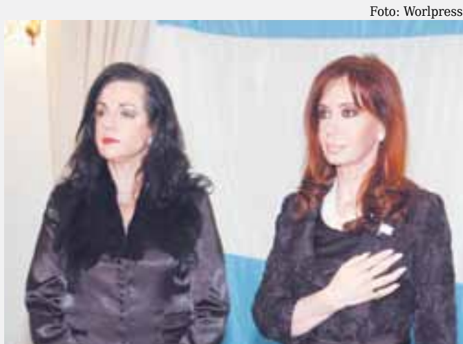
A ministra Nilda Garre com a presidente Cristina Kirchner