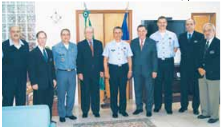
Dirigentes da ESG e ADESG durante reunião na sede da Escola

A primeira turma formada pelo curso foi batizada de "Nova Defesa" e é composta por 35 estagiários, que receberam conhecimentos essenciais para a compreensão e a análise de assuntos relacionados à Defesa Nacional.