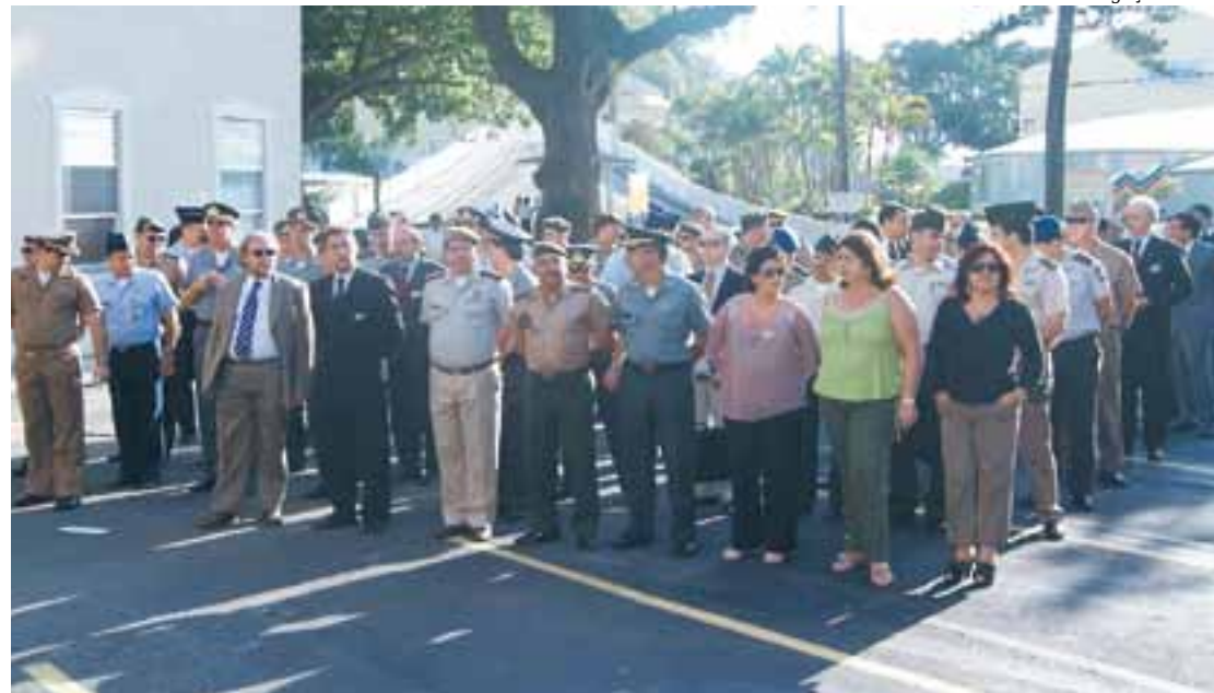
Estagiários do CAEPE 2010. Mais 88 Esguianos estão se formando no início de dezembro

O curso é destinado a preparar civis e militares, do Brasil e das Nações Amigas, para o exercício de funções de direção e assessoramento de alto nível