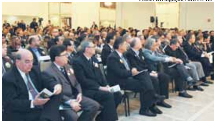
Agenda 2020, no Hotel Plaza, em Porto Alegre