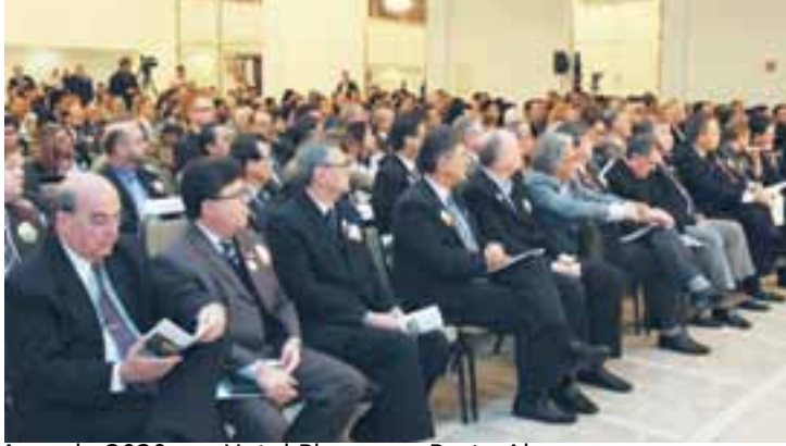
Agenda 2020, no Hotel Plaza, em Porto Alegre