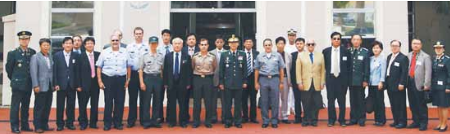
Em frente ao prédio da ESG, o grupo formado por 36 pessoas da cidade de Qinghai, na China, durante visita à instituição