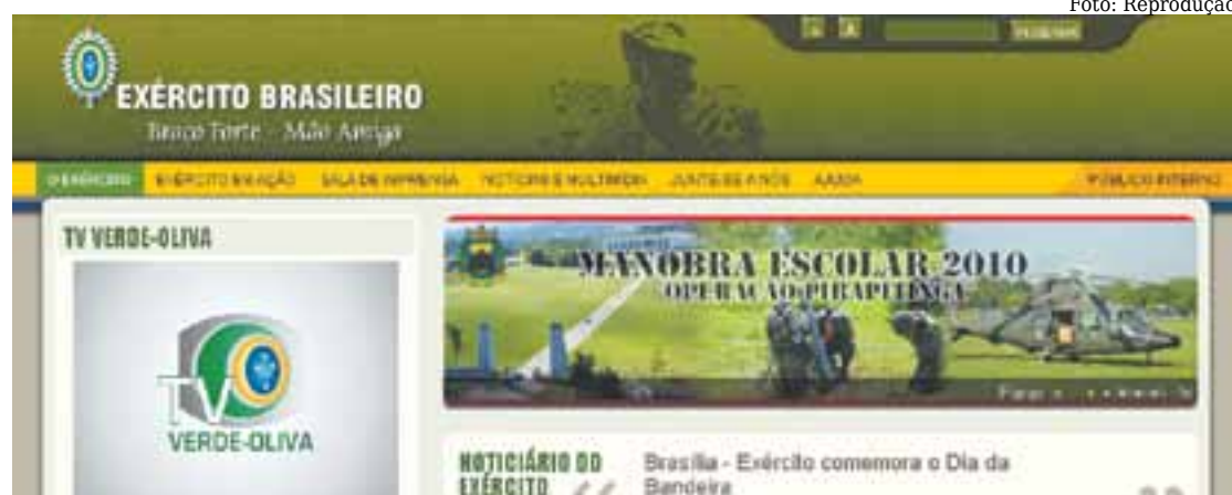
Imagem do novo portal do Exército Brasileiro. Objetivo foi facilitar navegabilidade