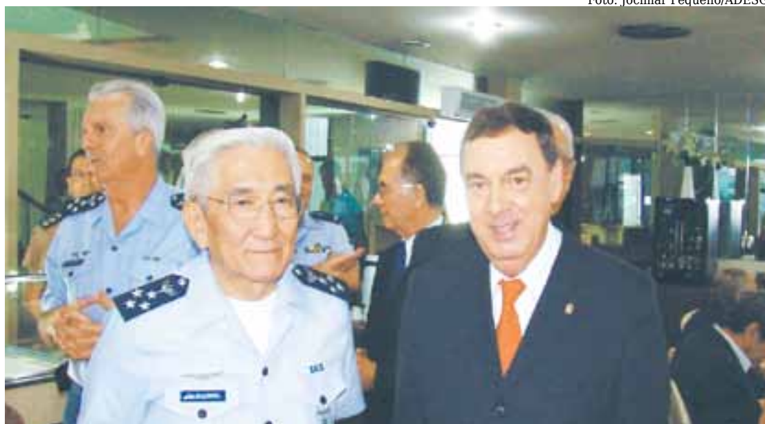
O Comandante da Aeronáutica, Ten Brig. Juniti Saito e o Brig. Helio Gonçalves; ao fundo, o Ten. Brig. Azevedo e o Ten Brig. Vilarinho

Os convites para participação nos eventos buscam estabelecer um equilíbrio abrangendo, como na ESG, civis e militares, participantes dos três poderes da República, políticos, dirigentes e empresários de destaque, sempre com algum relacionamento com a ADESG, com suas atividades ou com a sua filosofia operacional.