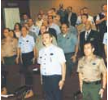
Estagiários durante o CAEPE