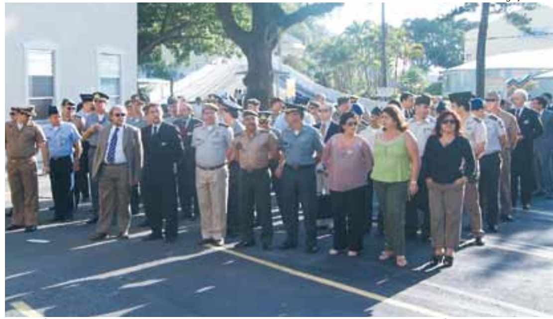
Estagiários do CAEPE 2010. Mais 88 Esguianos estão se formando no início de dezembro

O curso é destinado a preparar civis e militares, do Brasil e das Nações Amigas, para o exercício de funções de direção e assessoramento de alto nível