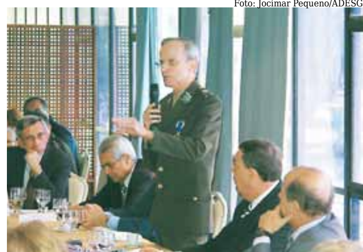
O comandante do Exército, Enzo Martins Peri