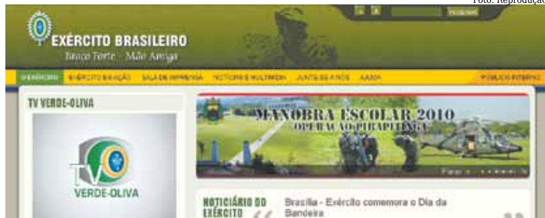
Imagem do novo portal do Exército Brasileiro. Objetivo foi facilitar navegabilidade