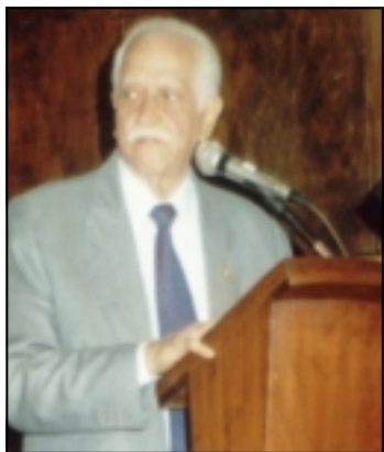
Rio de Janeiro, 18 de janeiro de 2002.

Em obediência ao rodízio estabelecido em nosso Estatuto assumimos, em eleição realizada em 21 de novembro de 2001, a responsabilidade de conduzir no biênio 2002/2003 os destinos da ADESG, no cumprimento da missão a ela atribuída.